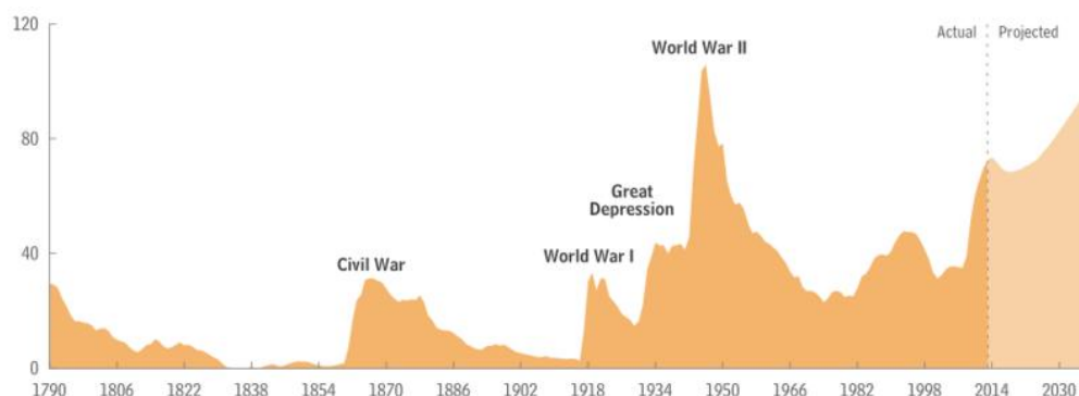
Фиг.2: Държавен дълг на САЩ в % от БВП