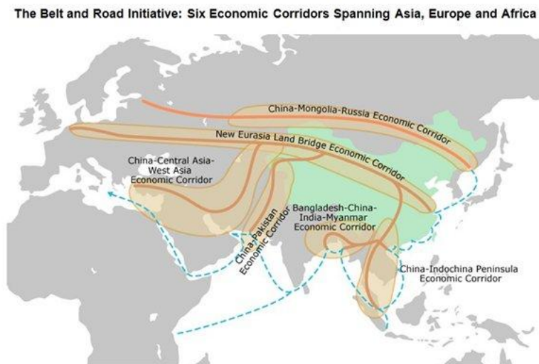
Фиг.3: Варианти на новия път на коприната през Средна Азия