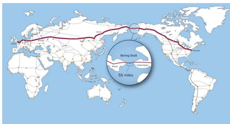
Фиг.4: Възможното включване на САЩ